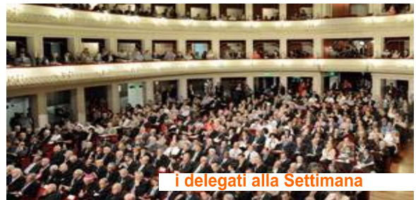
i delegati alla Settimana

F ederalismo solidale e "visione cattolica".