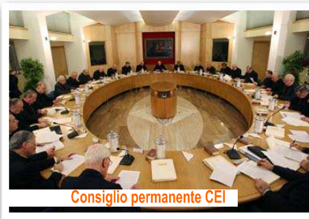
Consiglio permanente CEI

«La fluidità di valori, relazioni e riferimenti, non impedisce affatto - o favorisce - il formarsi di coaguli sovranazionali talmente potenti e senza scrupoli, tali da rendere la politica sempre più debole e sottomessa. Mentre invece dovrebbe essere decisiva, se la speculazione non avesse deciso di tagliarla fuori e renderla irrilevante e quasi inutile. Ed è quel che sembra accadere sotto gli occhi attoniti della gente».